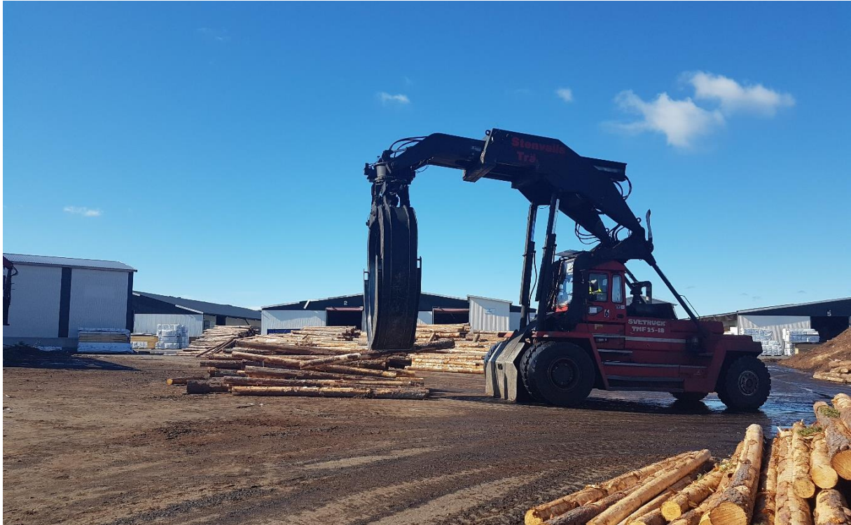
TMF-föraren håller bra koll på de olika testbatcherna så vi vet var timret växt.

Vi har redan kunnat bevisa att fördelningen mellan olika kvaliteter skiljer sig stort mellan olika avverkningar. Under juni har vi varit och spelat in data från tre olika avverkningar för att ta reda på mer. De data som spelas in är från mätram och röntgen, och ska sedan jämföras med det skogliga data (så som bonitet, höjd över havet, växtplats) som Sveaskog har, samt spåras till slutprodukten genom AIS-systemet (som kopplar samman timmersortering och justerverksdata).